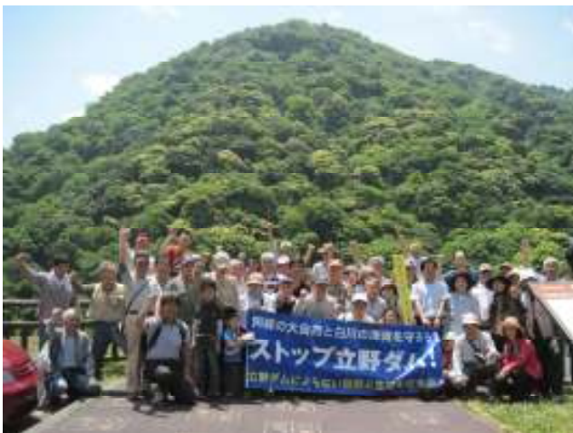
立野ダム予定地見学会。北向谷原始林をバックに 記念撮影 2013.5.18