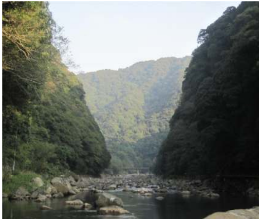
立野ダム本体建設予定地 V字谷の向こうは北向谷原始林

世界ジオパーク認定をめざす阿蘇にとって致命的なダメージとなります。阿蘇の価値が下がれば、熊本市も大きなダメージを受けます。